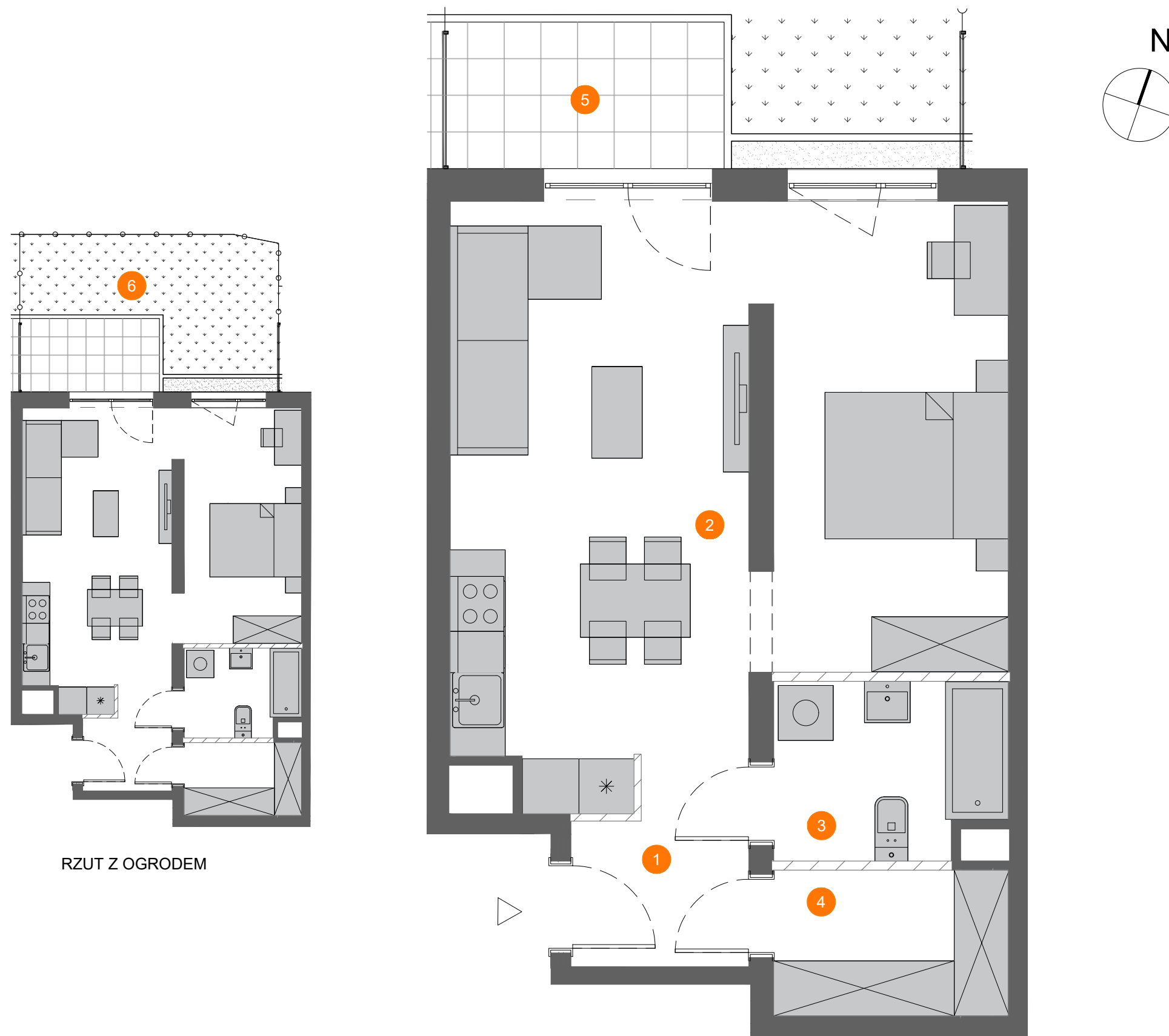
RZUT Z OGRODEM

UWAGA: 1. WYMIARY POMIESZCZEŃ, LOKALIZACJĘ PRZYBORÓW SANITARNYCH, ROZMIESZCZENIE PUNKTÓW INSTALACYJNYCH ITP. PODANO ZGODNIE Z PROJEKTEM BUDOWLANYM. MOGĄ WYSTĄPIĆ NIEWIELKIE RÓŻNICE WYMIARÓW I USYTUOWANIA ELEMENTÓW POWSTAŁE W TRAKCIE REALIZACJI PRAC BUDOWLANYCH. PODANE WYMIARY SĄ WYMIARAMI W ŚWIETLE PIONOWYCH PRZEGRÓD (ŚCIAN) W STANIE SUROWYM. 2. POWIERZCHNIA UŻYTKOWA LOKALU JEST OKREŚLONA NA PODSTAWIE ROZPORZĄDZENIA MINISTRA ROZWOJU Z DN. 11.09.2020 R. W SPRAWIE SZCZEGÓLOWEGO ZAKRESU I FORMY PROJEKTU BUDOWLANEGO ORAZ ZGODNIE Z ZASADAMI ZAWARTYMI W POLSKIEJ NORMIE PN-ISO 9836: 2022, T.J.: POWIERZCHNIA UŻYTKOWA LOKALU JEST OBLICZANA W METRACH KWADRATOWYCH Z DOKŁADNOŚCIĄ DO DWÓCH MIEJSC PO PRZECINKU, DLA WYMIARÓW LOKALU W STANIE WYKOŃCZONYM, NA POZIOMEJ PODŁOŻY. NIE LICZĄC LISTEW PRZYPODŁOGOWYCH, PROGÓW ITP. DO POWIERZCHNI UŻYTKOWEJ LOKALU WLICZA SIĘ POWIERZCHNIĘ ELEMENTÓW NADAJĄCYCH SIĘ DO DEMONTAŻU (RURY, KANAŁY), NIE SĄ WLICZANE POWIERZCHNIE PRZEKROJU POZIOMEGO ŚCIANEK DZIAŁOWYCH, POWIERZCHNIE OTWORÓW NA DRZWI I OKNA ORAZ NISZE W ELEMENTACH ZAMYKAJĄCYCH. 3. PRZEDSTAWIONA NA RZUCIE ARANŻACJA MA CHARAKTER PRZYKŁADOWY, UMEBLOWANIE NIE STANOWI WYPOSAŻENIA NABYWANEGO LOKALU.